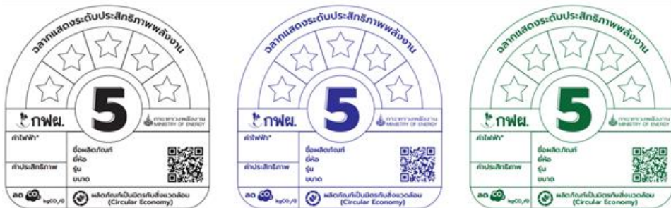
รูปที่ 8 ตัวอย่างฉลากฯ ที่สามารถแสดงบนกล่องบรรจุภัณฑ์