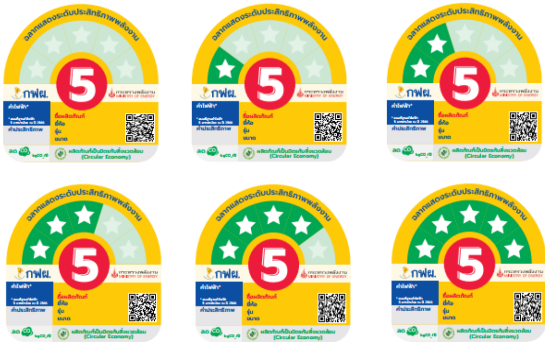
รูปที่ 7 ตัวอย่างฉลากฯ ที่สามารถลงโฆษณาได้