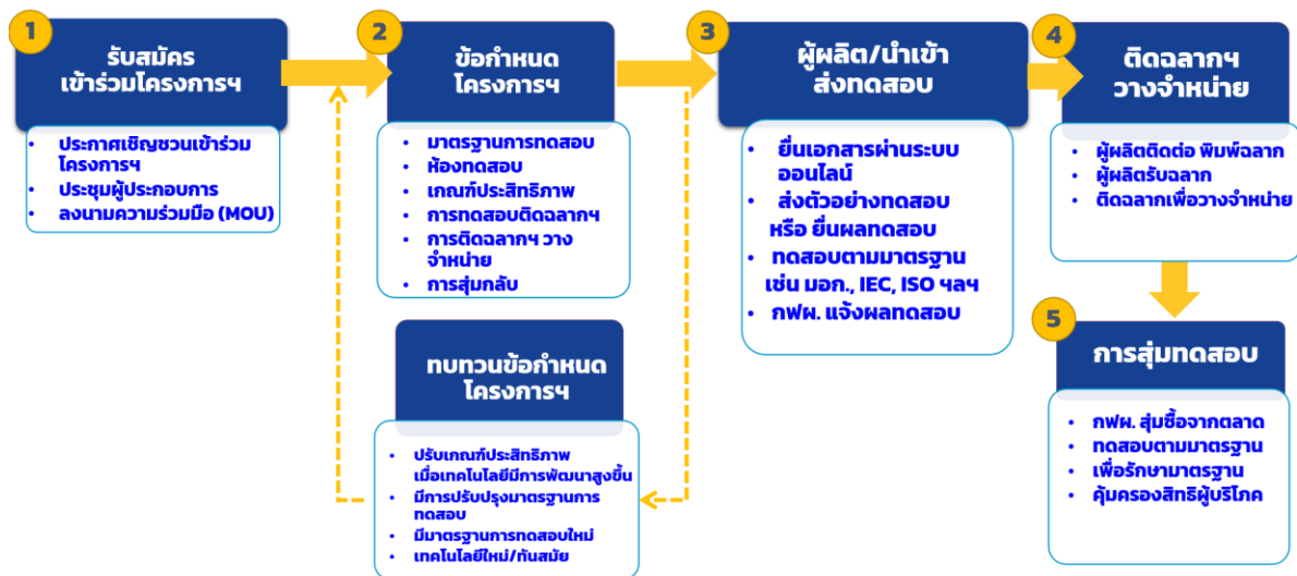
รูปที่ 1 ขั้นตอนการพัฒนาผลิตภัณฑ์เบอร์ 5