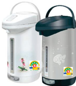
รูปที่ 5 การติดฉลากแสดงระดับประสิทธิภาพพลังงานของกระติกน้ำร้อนไฟฟ้า

ผู้เข้าร่วมโครงการฯ ต้องติดฉลากฯ บนผลิตภัณฑ์ให้ตรงตามรุ่นที่ผ่านการทดสอบ โดยติดฉลากฯ 1 ดวงต่อ 1 เครื่อง ที่ด้านหน้าของตัวกระติกน้ำร้อนไฟฟ้ามูมขวามือ ดังแสดงในรูป