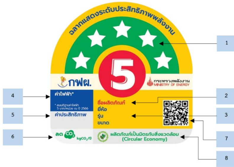
รูปที่ 4 รายละเอียดฉลากแสดงระดับประสิทธิภาพพลังงาน (ขนาดจริง : กว้าง 45 มม. สูง 45 มม.)