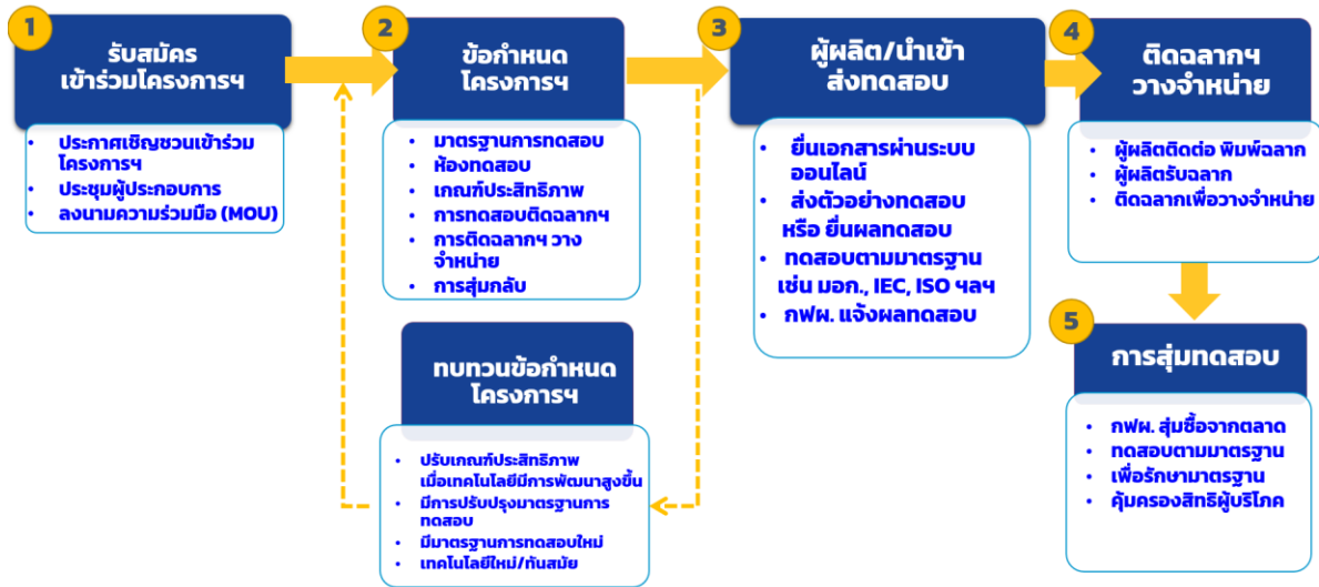
รูปที่ 1 ขั้นตอนการพัฒนาผลิตภัณฑ์เบอร์ 5

โครงการฯ สามารถยื่นทดสอบ ติดฉลากฯ และวางจำหน่ายสู่ท้องตลาด โดย กฟผ. มีกระบวนการสุ่มทดสอบ เพื่อรักษามาตรฐานและคุ้มครองสิทธิผู้บริโภค ดังนี้