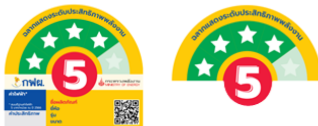
รูปที่ 9 ตัวอย่างฉลากฯ ที่ไม่สามารถลงโฆษณาได้

- รูปแบบฉลากฯ ที่ไม่สามารถลงโฆษณาได้ คือฉลากฯ ที่มีรายละเอียดไม่ครบถ้วน มีการตัดบางส่วนของฉลากฯ ออก ดังตัวอย่าง