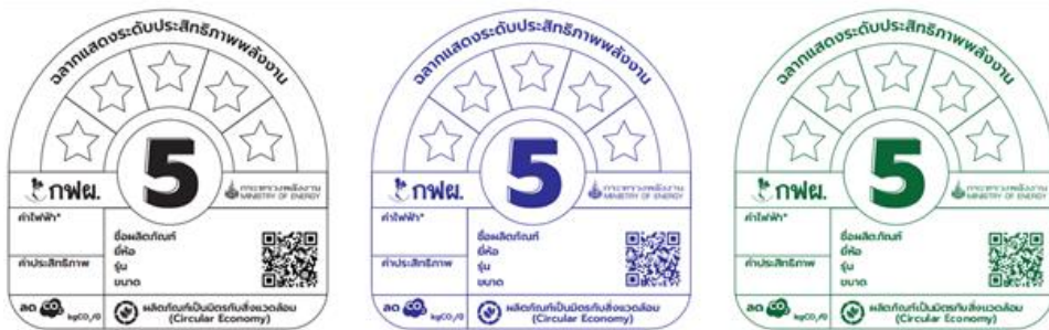
รูปที่ 8 ตัวอย่างฉลากฯ ที่สามารถแสดงบนกล่องบรรจุภัณฑ์

- รูปแบบฉลากฯ ที่สามารถแสดงบนกล่องบรรจุภัณฑ์ ต้องเป็นฉลากฯ พิมพ์ 1 สี ดังตัวอย่าง