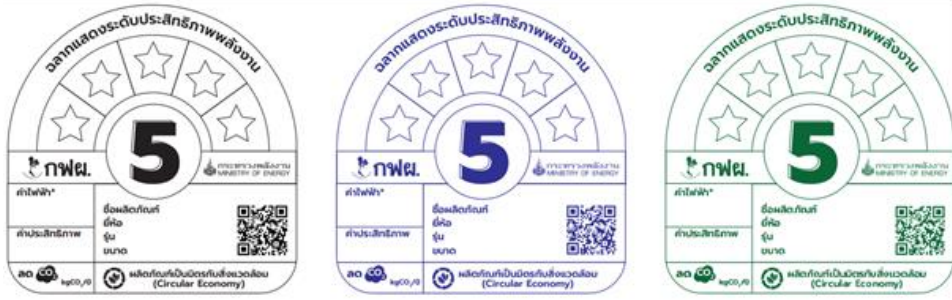
รูปที่ 8 ตัวอย่างฉลากฯ ที่สามารถแสดงบนกล่องบรรจุภัณฑ์

- รูปแบบฉลากฯ ที่ไม่สามารถลงโฆษณาได้ คือฉลากฯ ที่มีรายละเอียดไม่ครบถ้วน มีการตัดบางส่วนของฉลากฯ ออก ดังตัวอย่าง